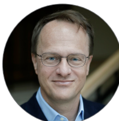
Univ. Prof. Dr. Markus Hengstschläger

Keynote-Speaker und Leiter des Instituts für Medizinische Genetik an der Medizinischen Universität Wien